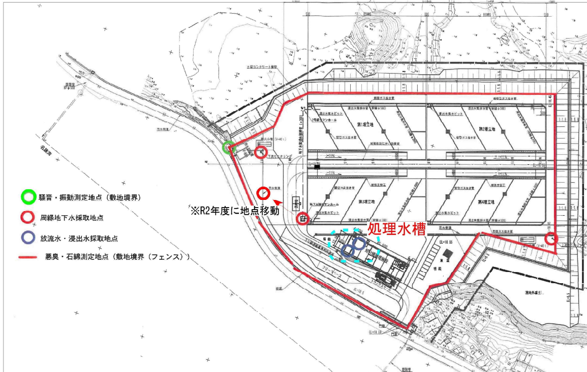
図 3-2 放流水（処理水）水質調査地点図