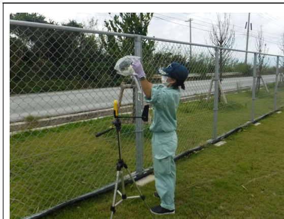
悪臭測定地点（風上側）